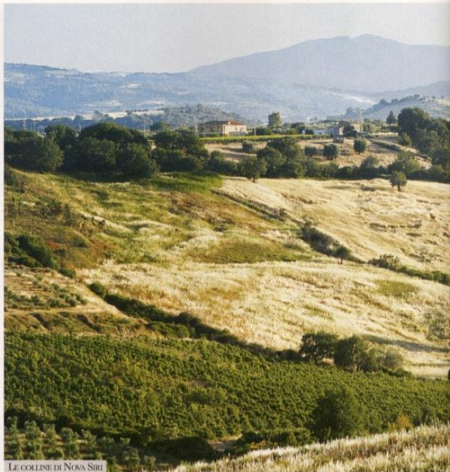
LE COLLINE DI NOVA SIRI